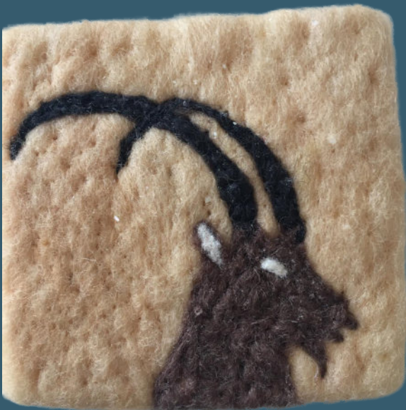
Steinbock-Kopf BR 64006