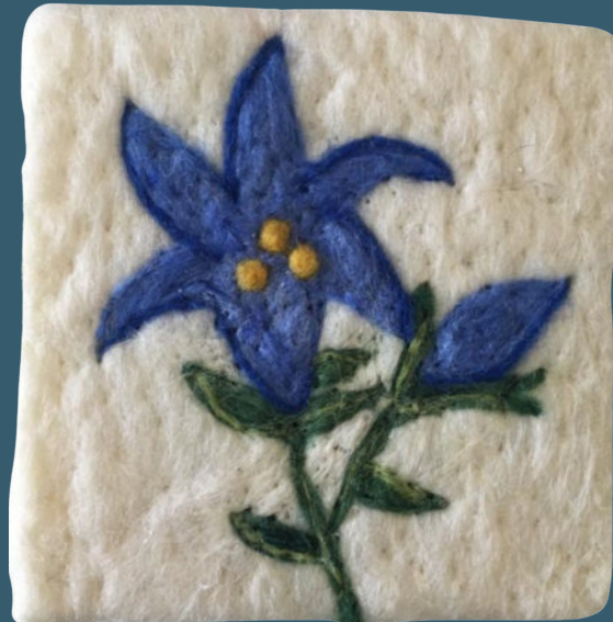
Enzian BR 64024