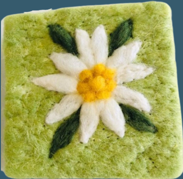
Edelweiss BR 64000