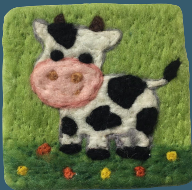
Kuh BR 64026