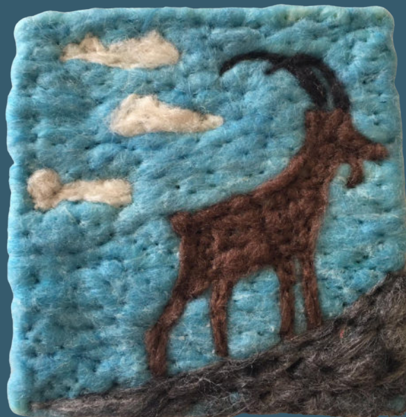
Steinbock BR 64005