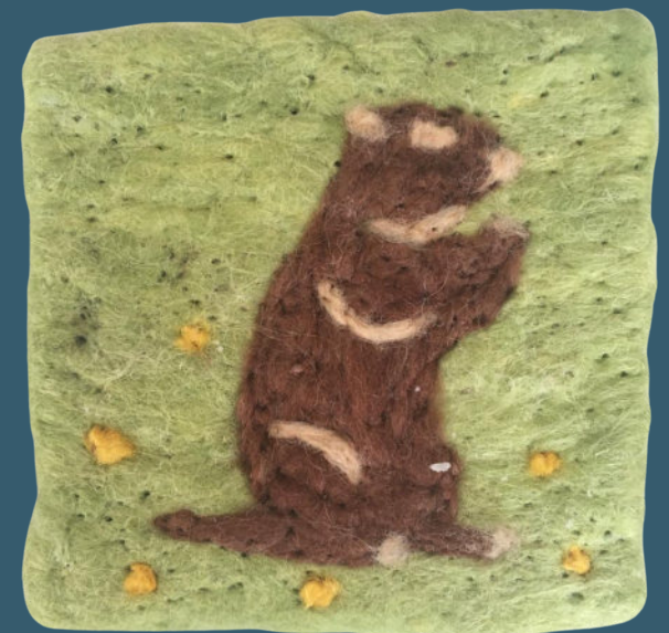
Murmeltier BR 64007