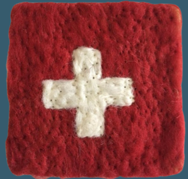
CH-Kreuz BR 64008