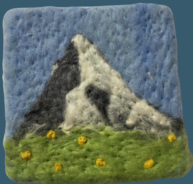
Matterhorn BR 64027